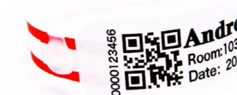
БРАСЛЕТЫ + ЭТИКЕТКИ