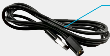
Кабель зарядки и передачи данных