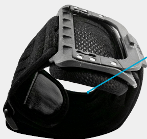
Крепление на руку

обхват руки 215 мм - 350 мм с регулятором размера.